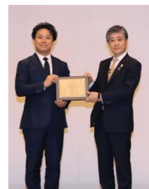
特別賞 贈呈の様子