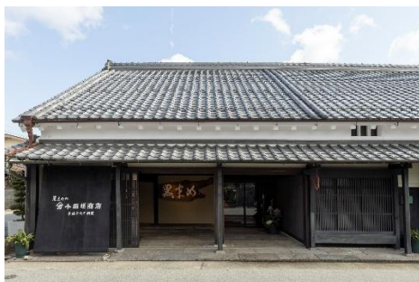
【本店（国登録有形文化財）】