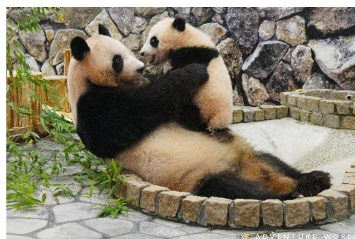
【ジャイアントパンダ親子】