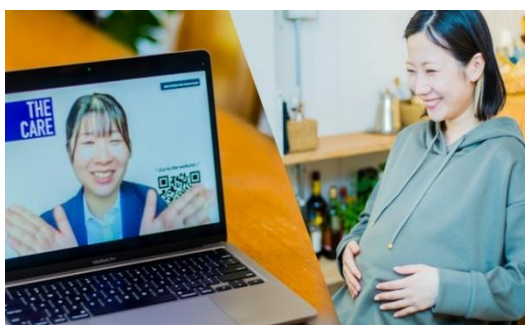
【自社の両立支援制度も理解した専門家に気軽に相談】