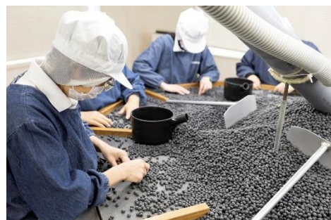
【伝統の手より選別】