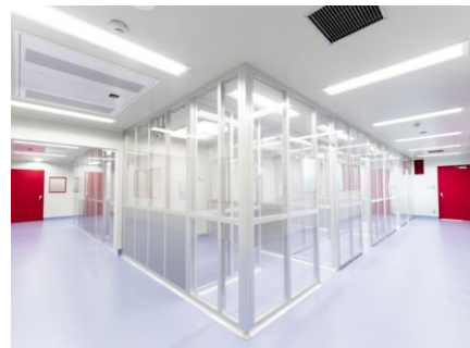
【商業用細胞培養加工施設（CLiC-1）】