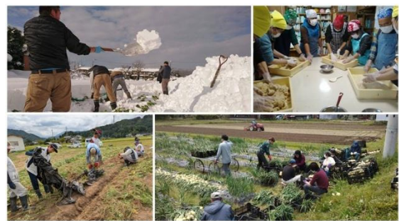
【大勢の若者が元気に活動】