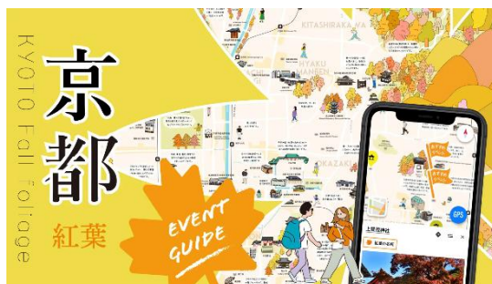
【京都イベントガイドマップ】