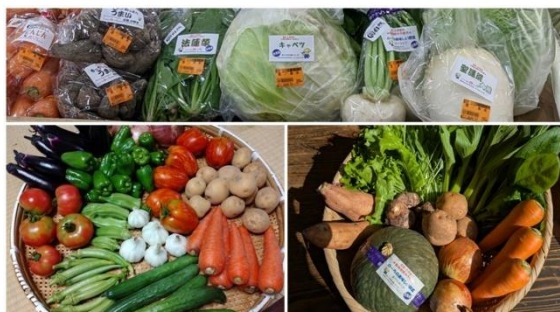
【年間を通じて野菜を栽培】