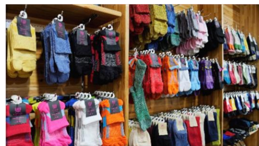
【エコノレッグ直営店】