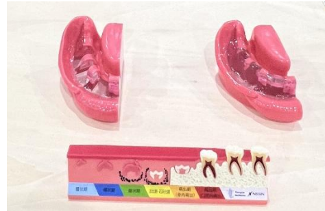
【歯の再生医療の概念を示した説明用模型】