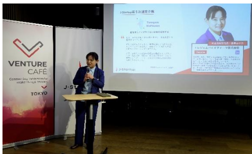
【J-Startup 追加選定での登壇】