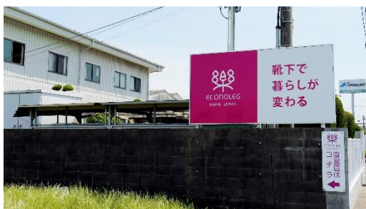
【西垣靴下工場外観】