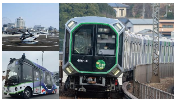
【鉄道（中央線 400 系）／自動運転バス／空飛ぶクルマ】