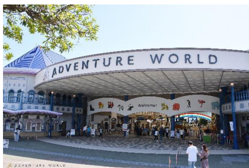
【アドベンチャーワールド外観】