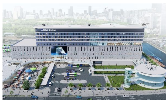
【森之宮新駅周辺のデザインパース】