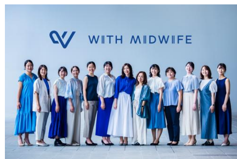
【オンラインを駆使し助産師に新しい働き方を提案】